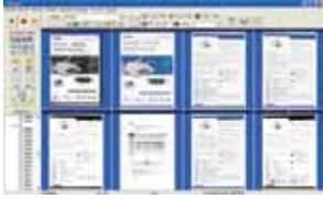
La pantalla principal del AvScan 5.0

-El Administrador de Documentos Inteligente